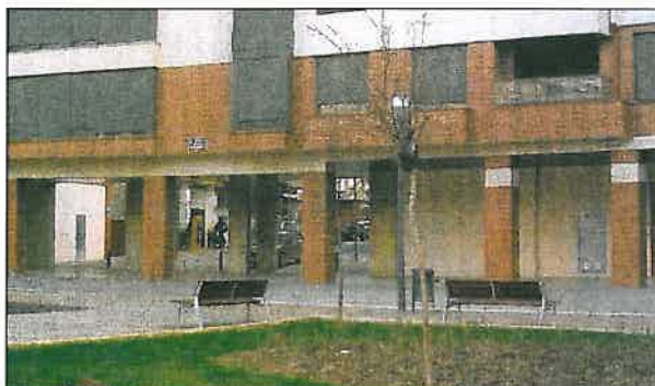
Plaza Martínez Flamarique, 8 (entrada)

La idea que tenemos es que desde este nuevo local se pueda ofrecer el servicio de Atención Temprana y algún otro que nos permita liberar alguno de los pisos de Muro de la Mata con objeto de poder emprender en ellos nuevos proyectos como por ejemplo “Vida Autónoma” dirigida a los mayores.