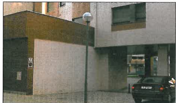
c/Villegas (parte trasera del local)